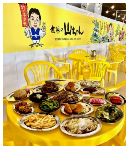
※画像は第1弾開催時のものです。