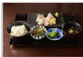
鮮魚お造り盛り合わせ定食 市場直送の旬の鮮魚のランチをお 楽しみください。