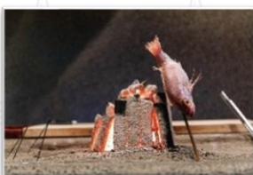
原始焼き シェフこだわりの鮮魚を炭火 でじっくり焼き上げ表面はパ リッと中はふっくら魚の旨味 を最大限に引き出します。