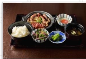
飛騨牛すき陶板定食 飛騨牛肩バラ肉を甘辛いタレ で仕上げた贅沢な逸品です。 温泉卵を絡めてお召し上がり ください。