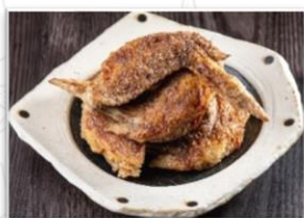
幻の手羽先 1人前5本 コショウ辛さがやみつきに なる看板商品です

オープンに際し、3日間限定先着50名様にランチご利用の方へたい焼きお土産プレゼント、 ディナーではお造りのサービスをいたします。シェフこだわりの鮮魚をお召し上がりには是非、ご 来店ください。